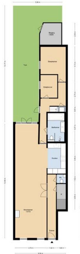
DE CARPENTIERSTRAAT 16 SITUATIE

DEZE PLATTEGRONDEN ZIJN MET DE GROOTSTE ZORG SAMENGESTELD EN DIENEN TER INDICATIE. ER KUNNEN GEEN RECHTEN AAN WORDEN ONTLEEND. © WWW.DROOMHUIS360.NL