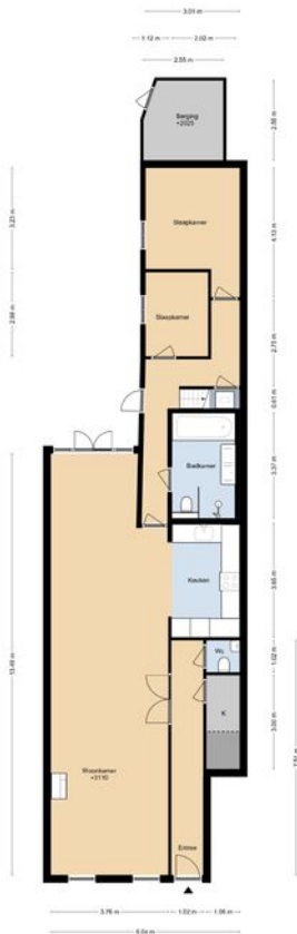
DE CARPENTIERSTRAAT 16 BEGANE GROND

DEZE PLATTEGRONDEN ZIJN MET DE GROOTSTE ZORG SAMENGESTELD EN DIENEN TER INDICATIE. ER KUNNEN GEEN RECHTEN AAN WORDEN ONTLEEND. © WWW.DROOMHUIS360.NL